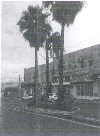
Figura 1 – Vista das palmeiras.

Diante disso, recomendamos a supressão das palmeiras. Ressaltamos que a palmeira jervá ( Syagrus romanzoffiana ) deverá ser preservada.