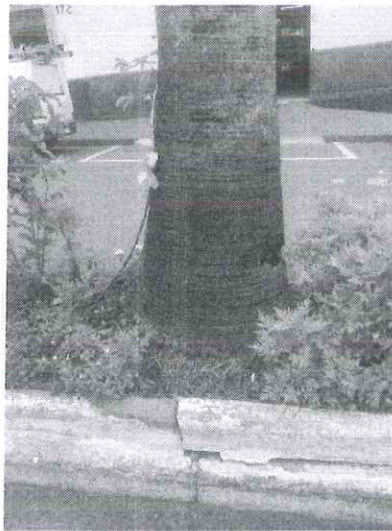
Figura 2 – Vista dos comprometimentos.